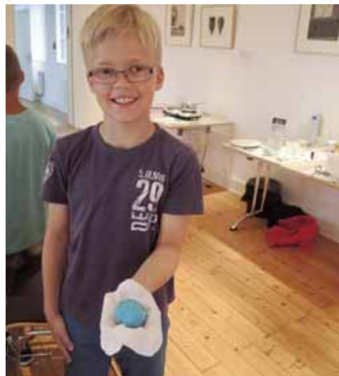
Bunte Badebomben in blau und rosa sorgen für zischenden Badespaß zu Hause. Zum besseren Transport gab es noch ein Schutzsäckchen dazu.