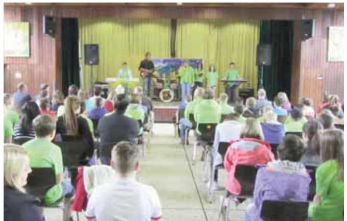
Die Gründungsfeier fand in der Aula des neuen Teilstandortes in Mechernich-Satzvey statt.

2017/ 2018 die Mittelstufe und zum Abschluss der Zusammenlegung die Oberstufe im Schuljahr 2018/ 2019. Bis dahin möchten Lehrer, Eltern und Schüler die Übergangszeit als aktionsreiche Kennenlernphase nutzen, beispielsweise mit gemeinsamen Festen und Feiern.