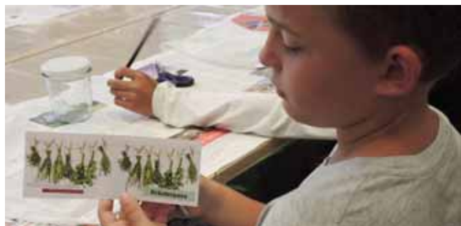
Am Ende des Tages gab es für jedes Kind Stempel im eigenen Kräuterpass.