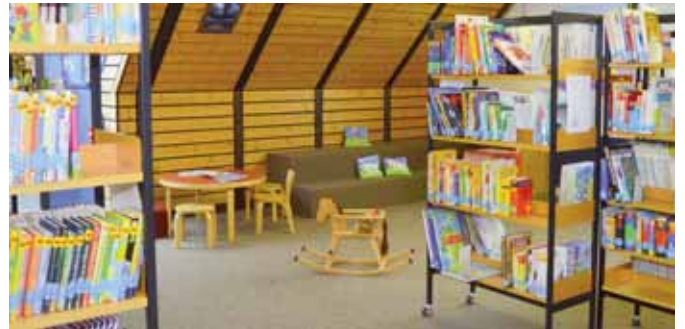
Die Stadtbibliothek Zülpich hat ihre früheren Räumlichkeiten wieder komplett übernehmen und einrichten können.