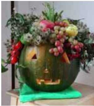
Am Samstag, 25. Oktober 2015 findet von 10 bis 16 Uhr

das „Familien-Drachenfest“ statt. Hier können Groß und Klein gemeinsam Drachen steigen lassen oder tolle Herbstdekorationen aus Kürbissen, Äpfeln und Birnen erstellen. Alle Kinder, die an diesem Tag einen selbst gebastelten Drachen mitbringen, erhalten freien Eintritt in den Gartenschaupark am See.